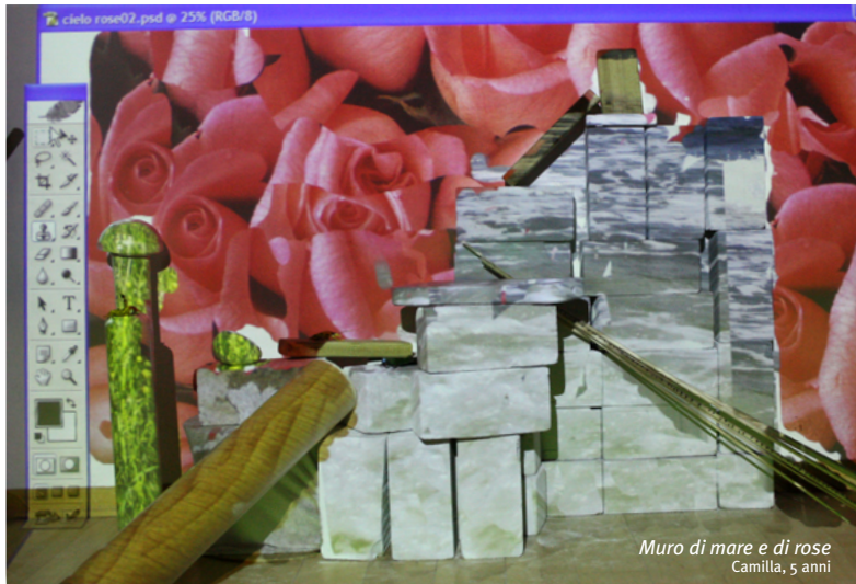
Muro di mare e di rose Camilla, 5 anni

Presentazione di progetti ed esperienze al nido e alla scuola dell'infanzia sull'incontro tra bambini e digitale